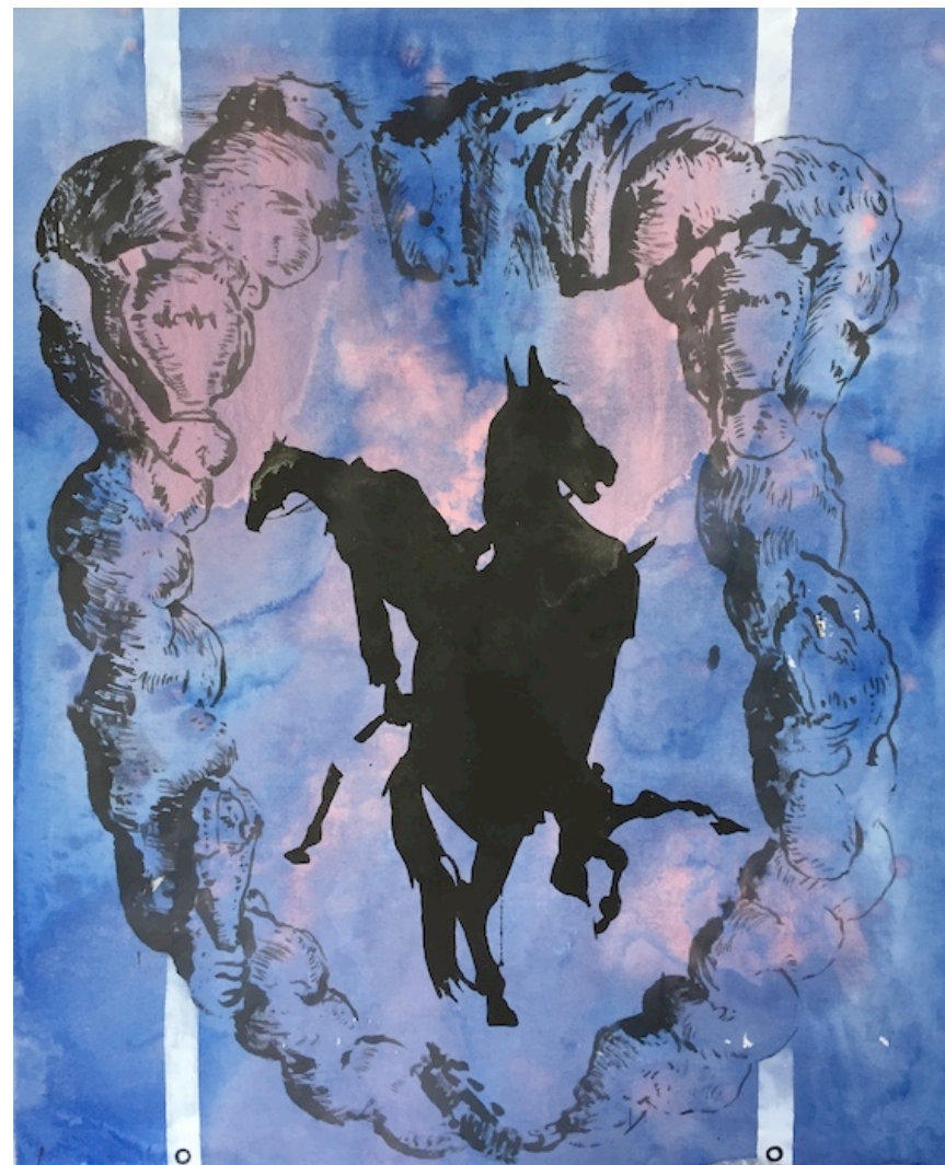
Hans Peter Adamski / Pferdefrau / 2009 / Acryl auf Nessel / 110 x 90 cm / 18.000 EUR