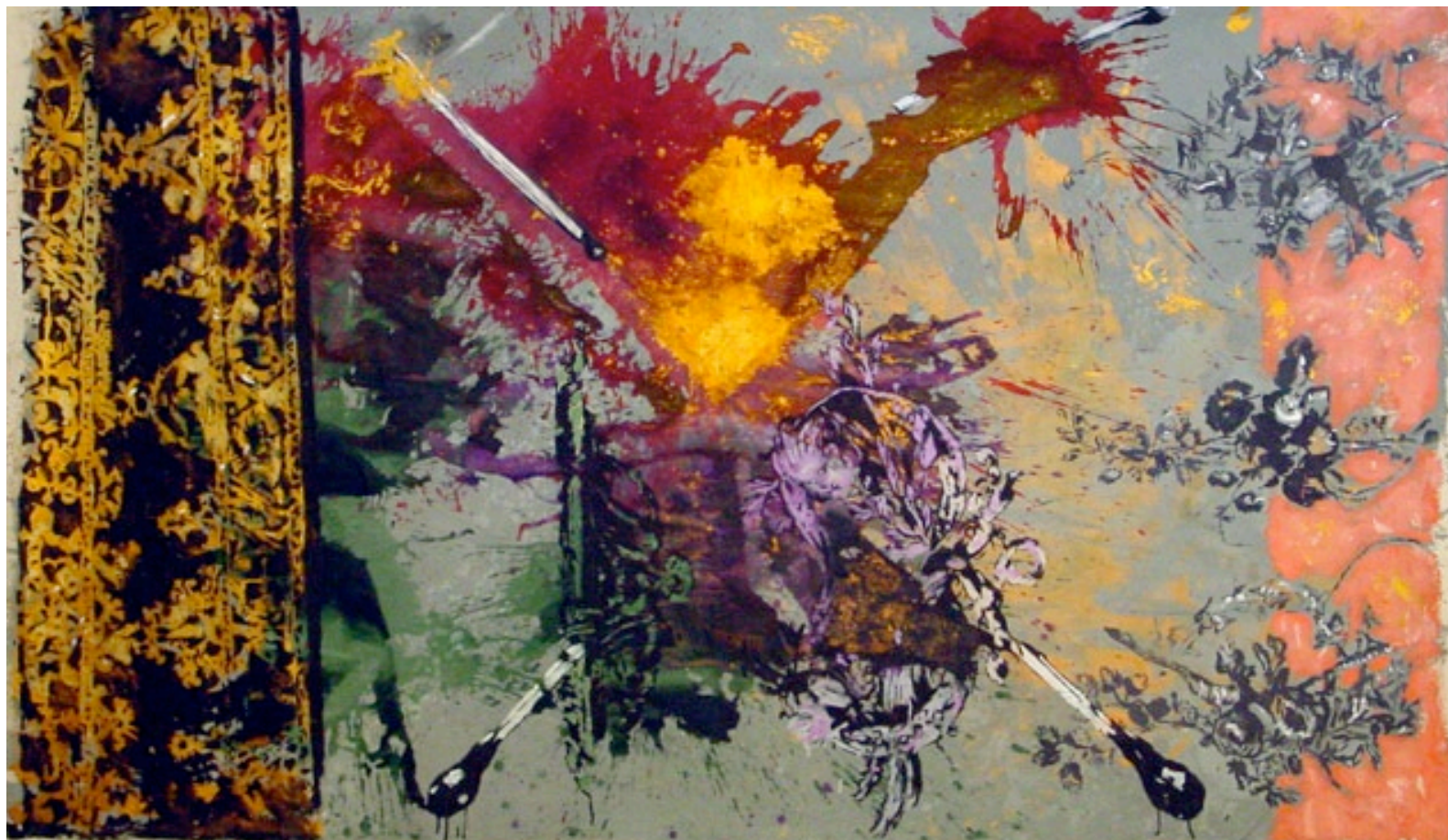
Hans Peter Adamski / LOBOPFER III / 1989 / Acryl und Metallpigment auf Leinwand / 156 x 290 cm / 53.000 EUR