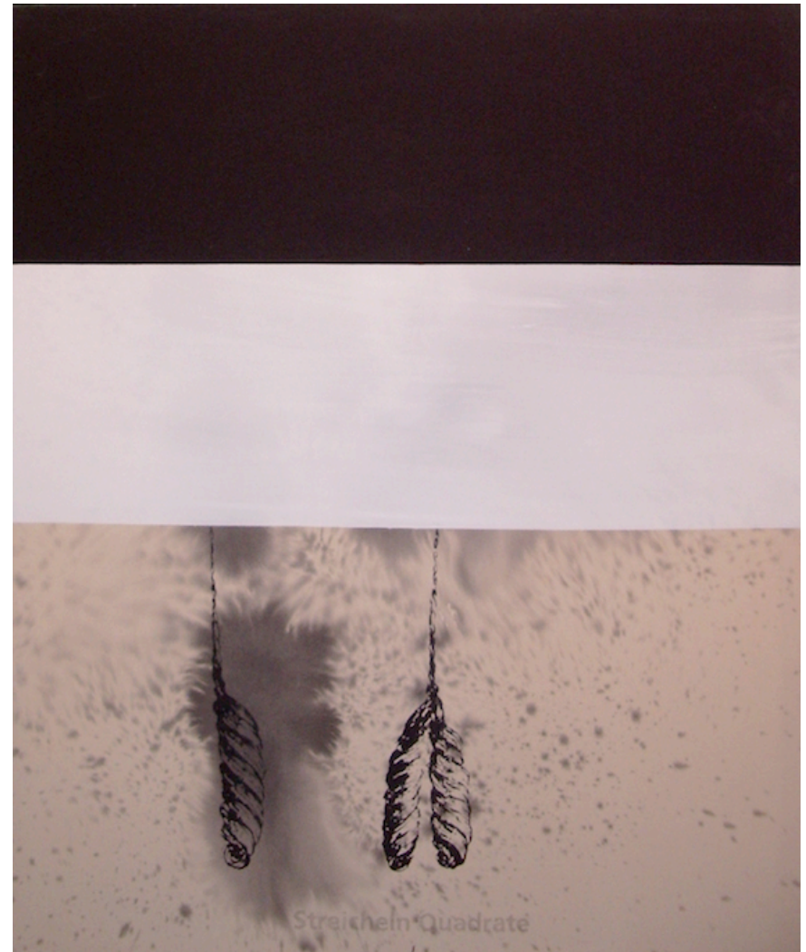
Hans Peter Adamski / Streicheln Quadrate / 2008 / Acryl auf Nessel / 180 x 150 cm / 42.000 EUR