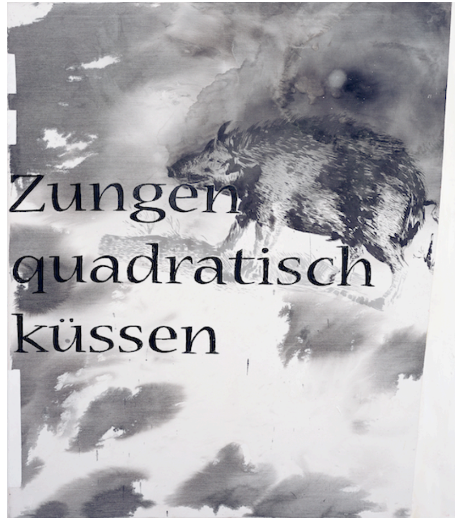
Hans Peter Adamski / Zungen quadratisch küssen / 2008 / Acryl auf Nessel / 140 x 120 cm / 32.000 EUR