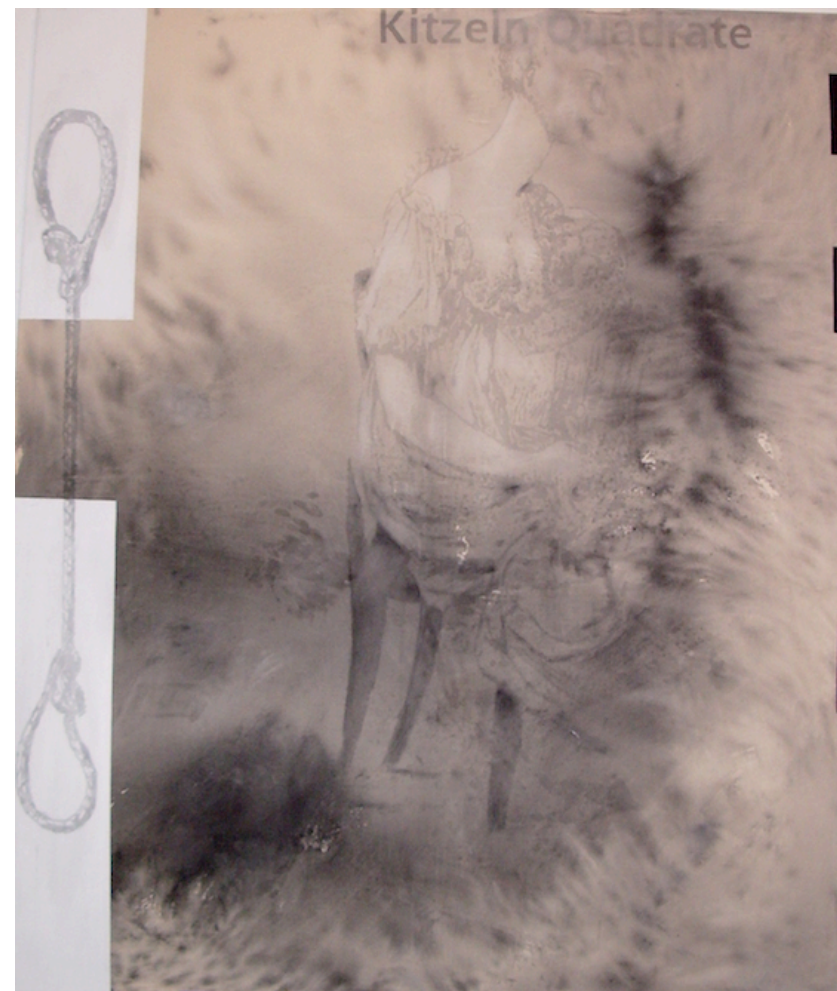
Hans Peter Adamski / Kitzeln Quadrate / 2008 / Acryl auf Nessel / 180 x 150 cm / 42.000 EUR